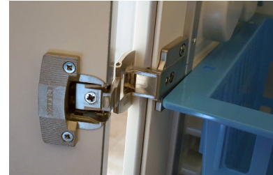
För optimal funktion använder vi ett Aximat-gångjärn av slimmad konstruktion med full öppningsvinkel.