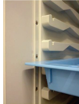
ABS-sida monterad utan monteringsprofil