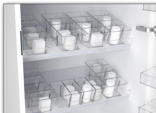
Tillval: Plastback Art. nr -----